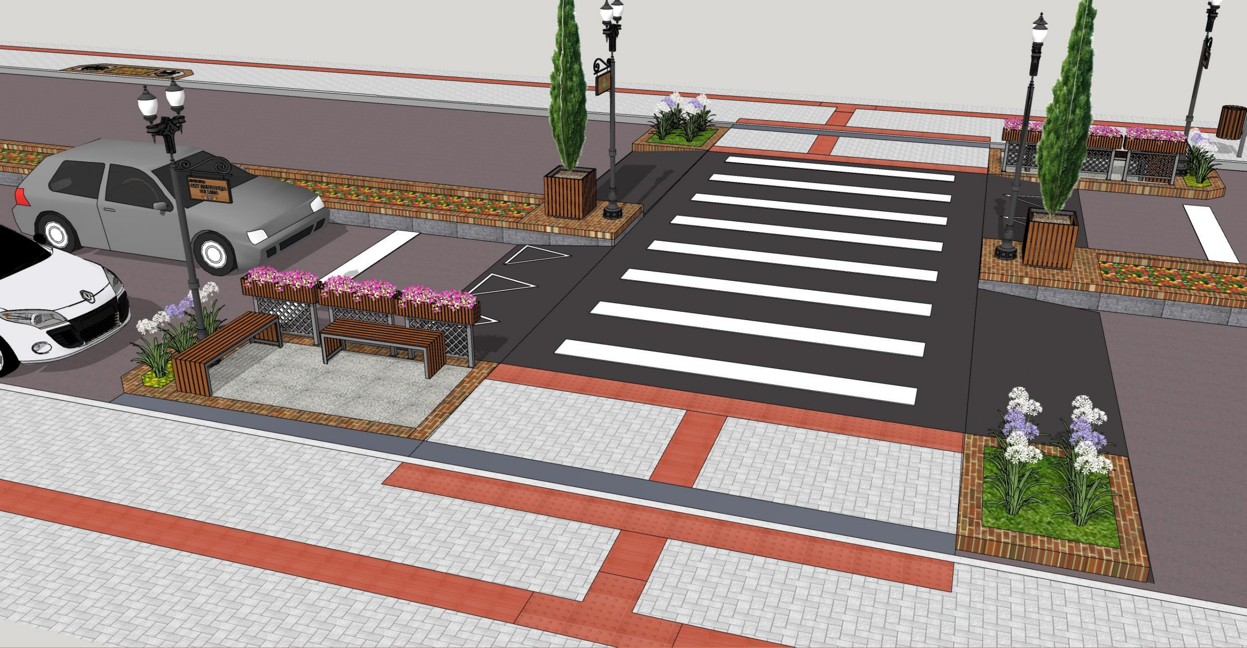
Travessias elevadas e espaços de estar