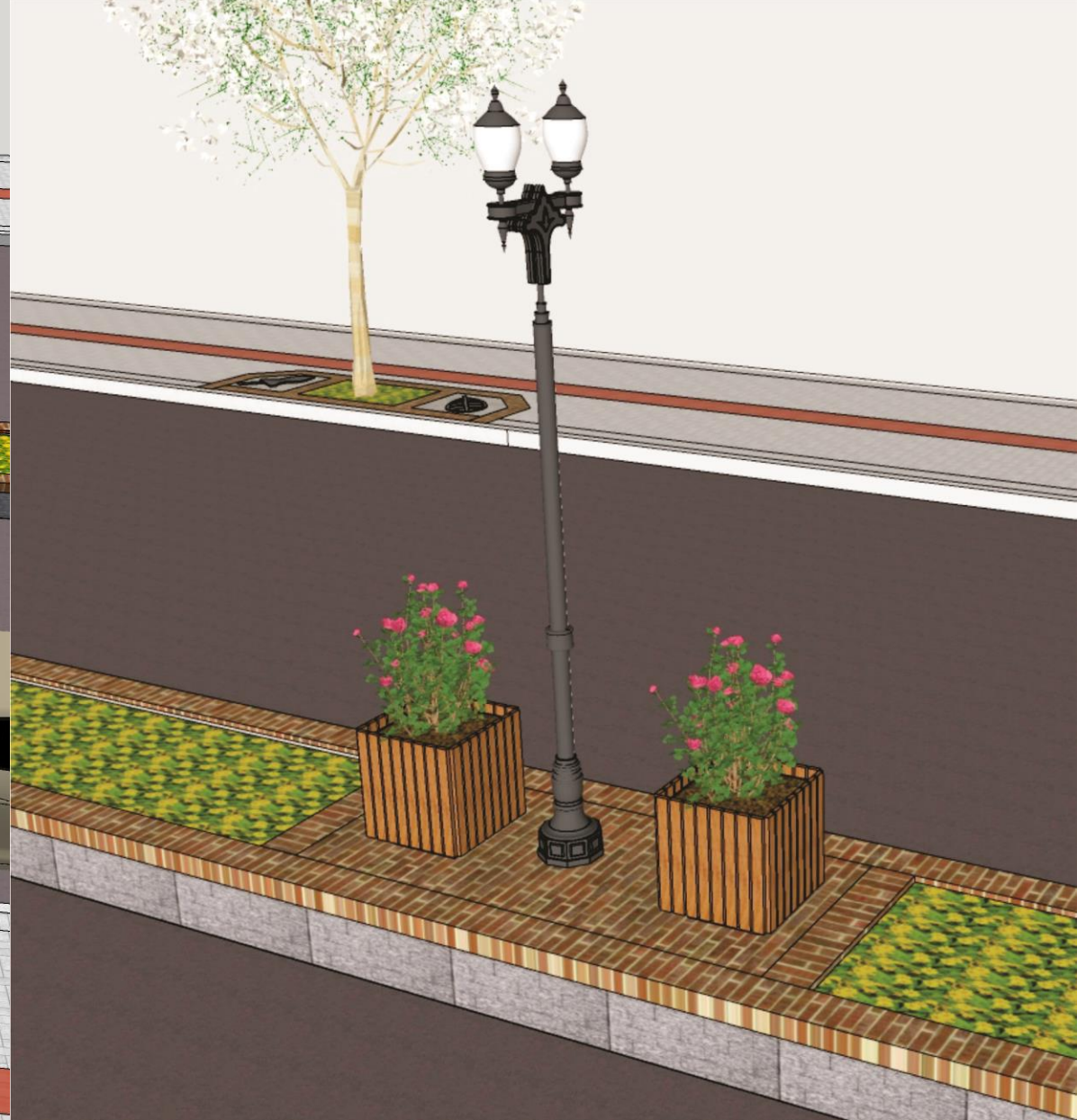
Detalhes calçadas e canteiros centrais