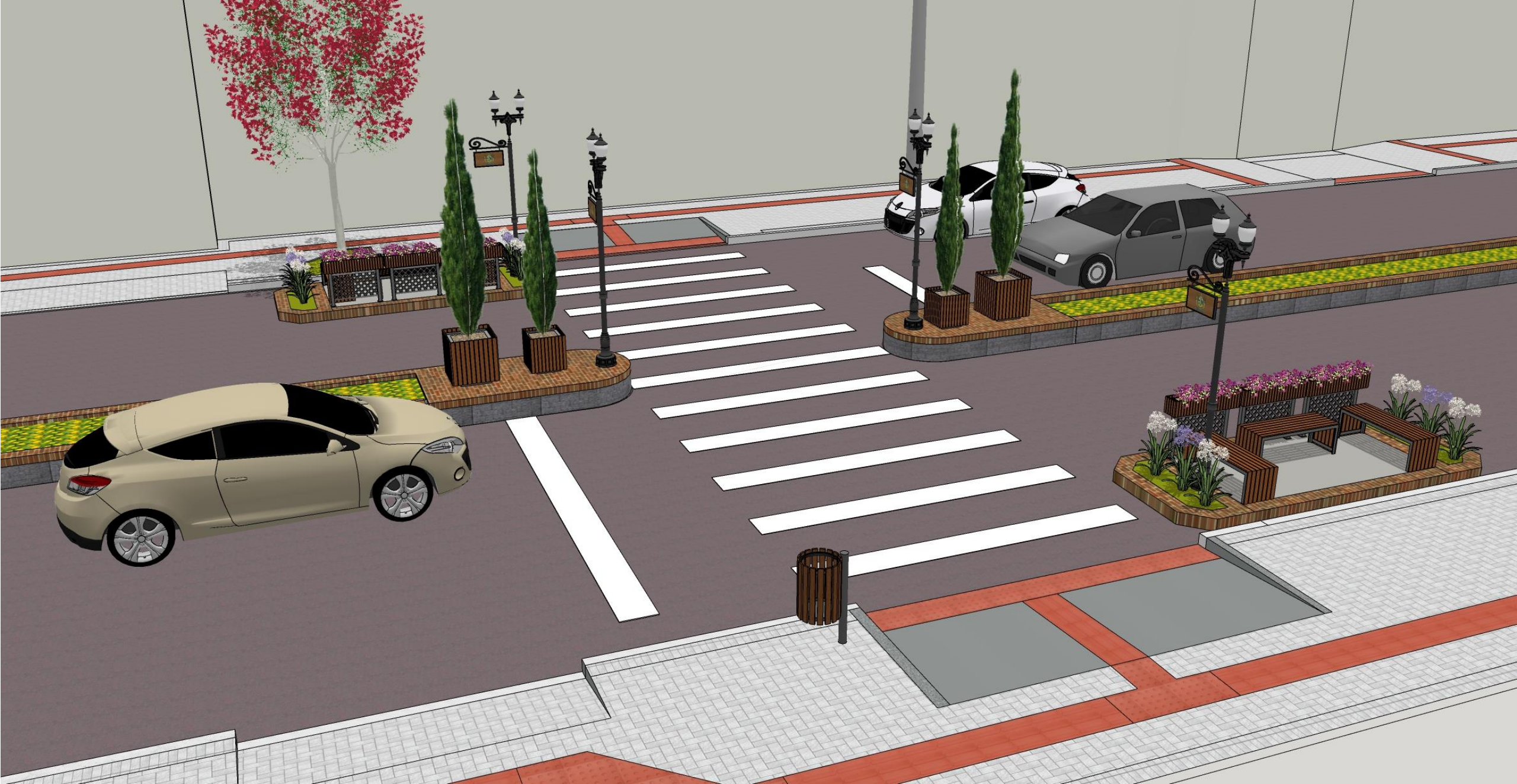
Travessias central com rampas e espaços de estar