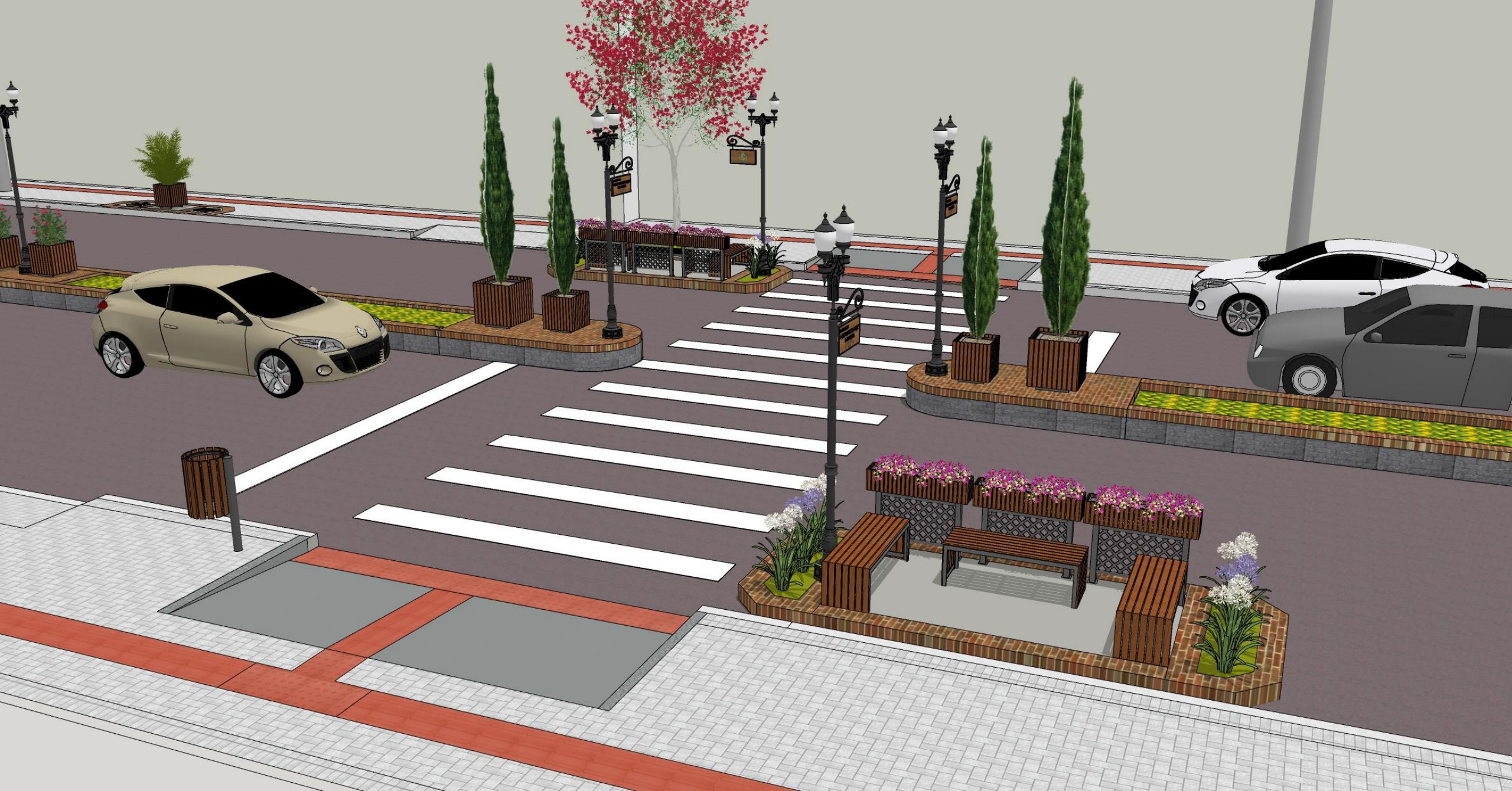
Travessias central com rampas e espaços de estar